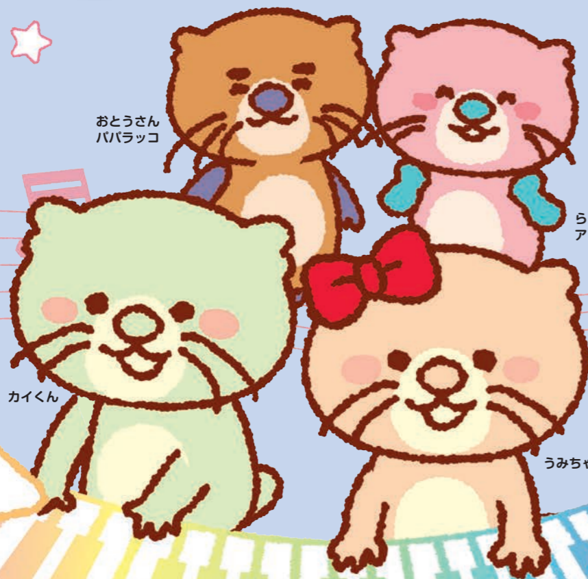
らっこママの アッコさん