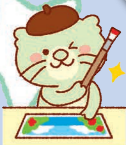
おとうさん ババラッコ